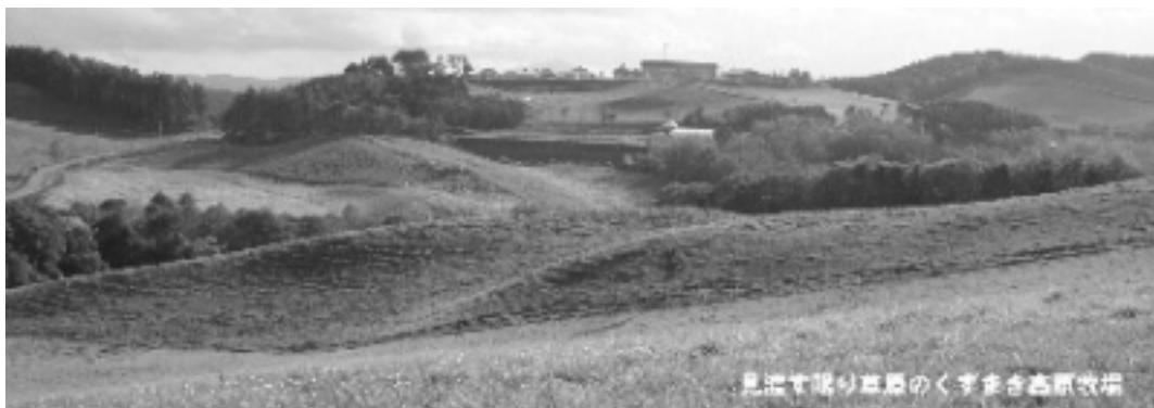
見逃す可い風景のくずまき高原牧場