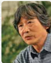
株式会社モンベル