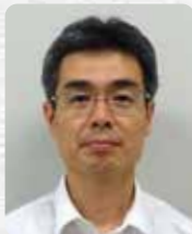
国土交通省 近畿地方整備局