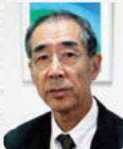
社会福祉法人 青葉仁会