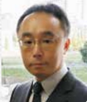
厚生労働省 社会・ 援護局 障害福祉課