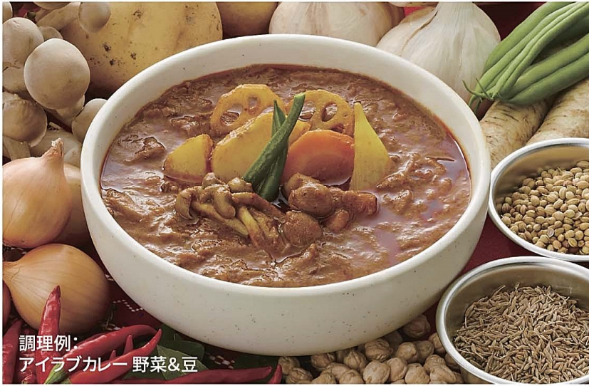
調理例: アイラブカレー 野菜&豆