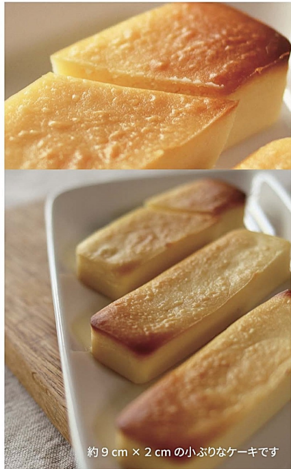
約9cm × 2cmの小ぶりなケーキです