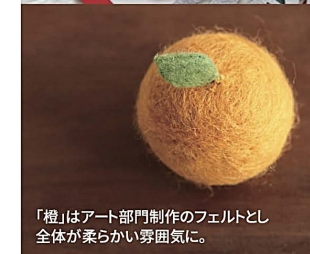
「橙」はアート部門制作のフェルトとし全体が柔らかい雰囲気。