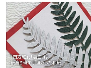
「四方紅」「裏白」は紙漉き班で手漉きした和紙