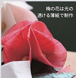
梅の花は光の透ける薄紙で制作