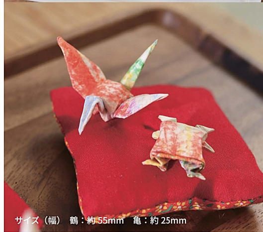
サイズ(幅) 鶴：約 55mm 亀：約 25mm