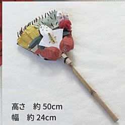
高さ 約 50cm 幅 約 24cm