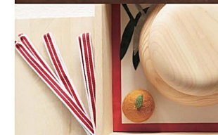
「三方」にもなるサイズで制作した収納箱にすべてがぴったりと収まります。