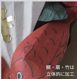
鯛・扇・竹は立体的に加工