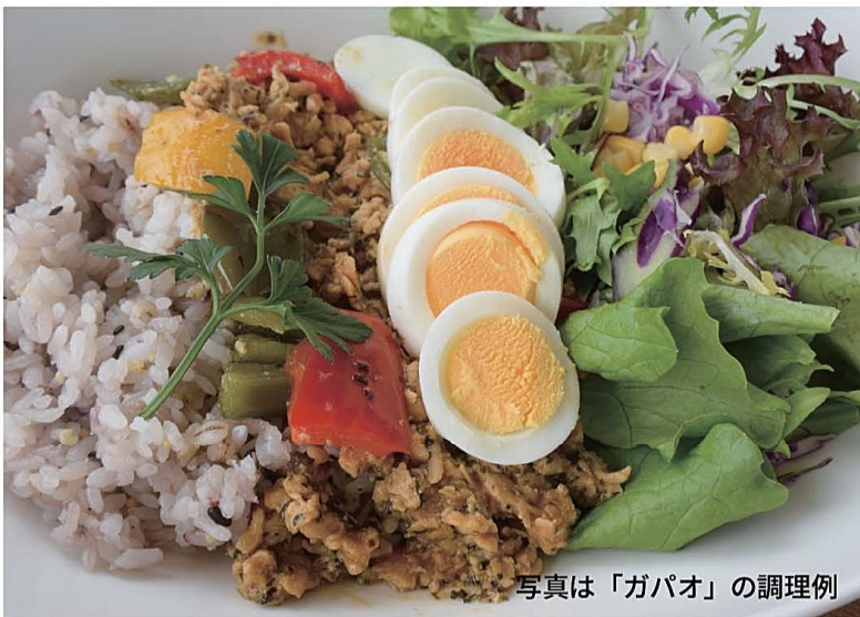
写真は「ガパオ」の調理例