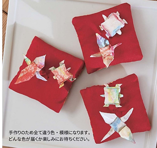
手作りのため全て違う色・模様になります。どんな色が届くか楽しみにお待ちください。