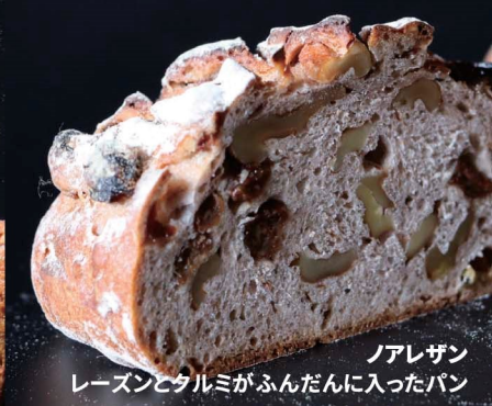
ノアレザン レーズンとタルミがふんだんに入ったパン