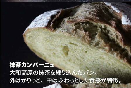
抹茶カンパーニュ 大和高原の抹茶を練り込んだパン。 外はかりっと、中はふわっとした食感が特徴。