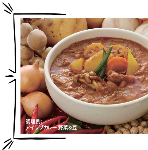
調理例： アイラブカレー 野菜&豆