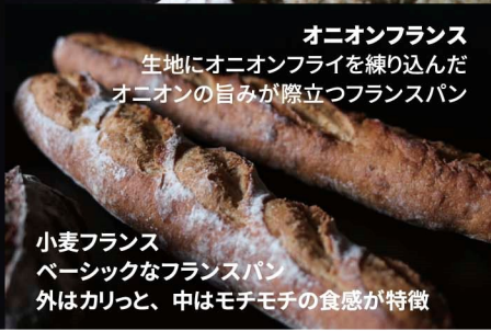
オニオンフランス 生地にオニオンフライを練り込んだ オニオンの旨みが際立つフランスパン