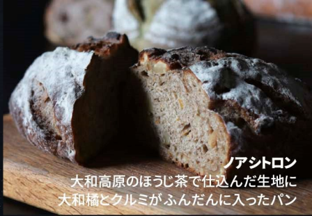
ノアイトロン 大和高原のほうじ茶で仕込んだ生地に 大和橘とクルミがふんだんに入ったパン

クラムボンが得意としているハード系のパンを 国産小麦だけで作った特別なパンセットです。 あおはに産小麦のほか、数種の国産小麦をブレンド。 各パンには大和高原で育った大和茶のほか、 法人内で製造された大和橘ペースト、 オニオンフライを使用しています。 香り豊かなあおはに小麦パンを是非ご賞味ください。