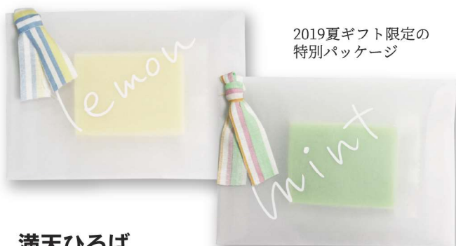
2019夏ギフト限定の特別パッケージ